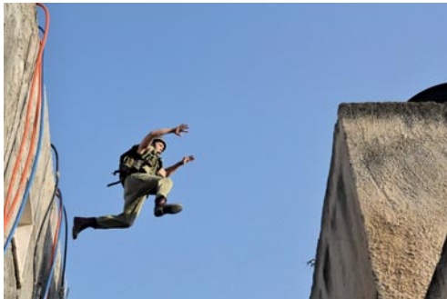
Rock the Casbah