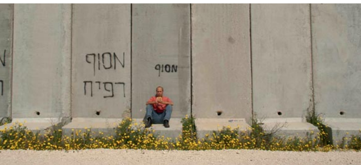
Oben: Luxuries – Motarot

Fischer am Strand, Bauern auf dem Feld, eine Hirtin, ein Rapper, eine Fernsehreporterin. Jugendliche beim Extremsport, ein Fußballtrainer, ein Fotoreporter. Das Stadion ist zerschossen, am Feld fahren gepanzerte Fahrzeuge vorbei, die Jugendlichen filmen ihre Saltos-rückwärts am Strand – am Horizont eine Explosion, der Fotograf sitzt im Rollstuhl. Eine stille Beobachtung der alltäglichen Selbstbehauptung im Gazastreifen.