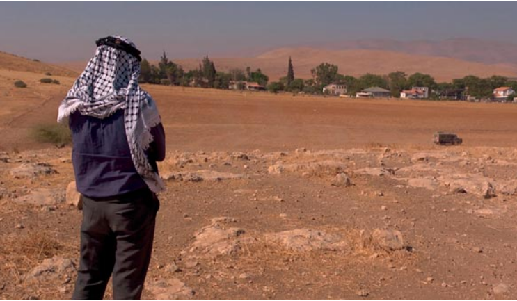
The Fading Valley

Sie existiert seit 1985. Ihr Hauptanliegen sieht sie darin, auch auf die deutsche Politik dahingehend einzuwirken, dass Juden und Araber gleichberechtigt im historischen Palästina miteinander leben können, dass die Besetzung der palästinensischen Gebiete und jede Form von Gewalt beendet und ein Weg zum Frieden endlich eingeschlagen werden. ( www.jpdg.de )