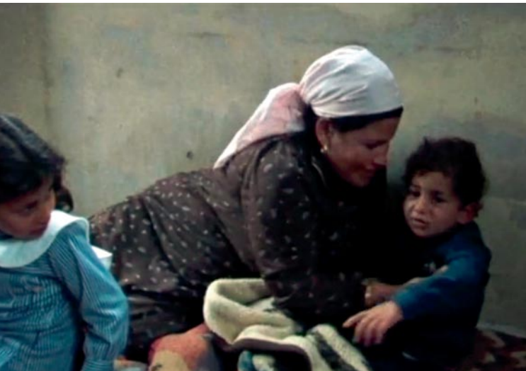
Ghaza Ghetto – Portrait of a Palestinian Family (1948–84)