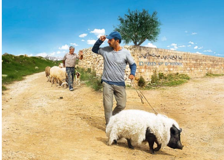
Das Schwein von Gaza