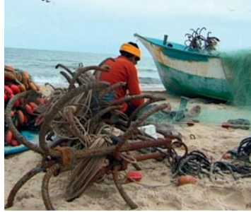
Men on the Edge: Fishermen's Diary