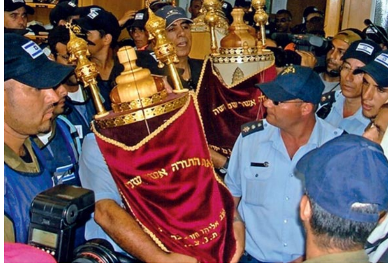
Storm of Emotions