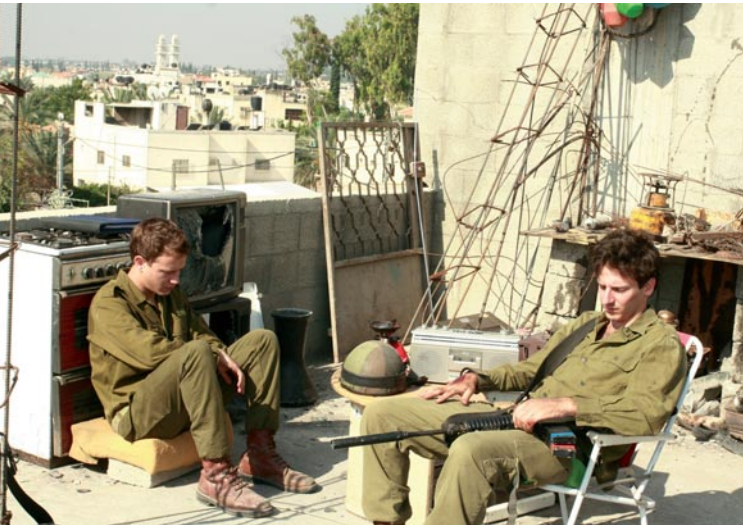
Rock the Casbah

Sommer 1989, Gazastreifen, Intifada. Von einem Dach schmeißen Jugendliche eine Waschmaschine auf eine israelische Patrouille. Ein Soldat wird getötet. Die Armee errichtet einen Wachposten auf diesem Dach. Von hier sollen die Soldaten den Täter finden und ihren Kameraden rächen. Vier israelische Teenager in Militäruniform, vier komplett unterschiedliche Charaktere, die palästinensischen Bewohner und Bewohnerinnen des Hauses, Stress, Eskalation, Normalität.