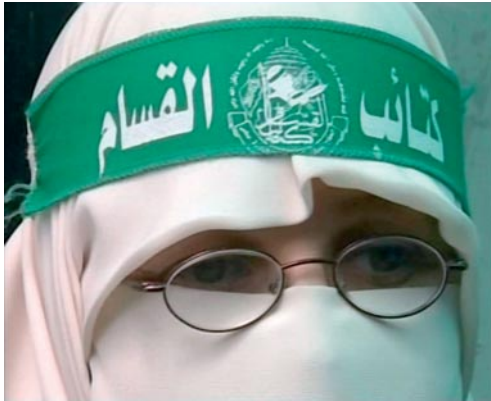
Women of Hamas