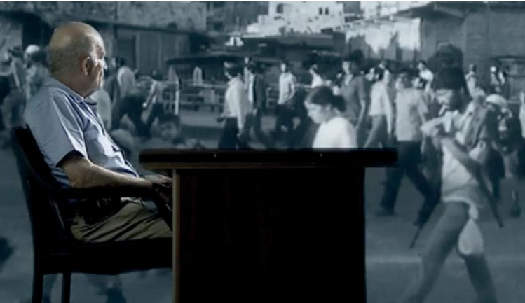
The Law in These Parts – Das Recht der Macht

Kann eine moderne Demokratie ein anderes Volk langfristig militärisch besetzen und dabei seine grundlegenden demokratischen Werte wahren? Der Regisseur befragt israelische Militärjuristen, verantwortlich für die Entwicklung des Besatzungsrechts oder dessen Ausführung, anhand ihrer eigenen Schriften und Urteilsprüche und legt ebenso klug wie spannend ein paralleles israelisches Rechtssystem offen.