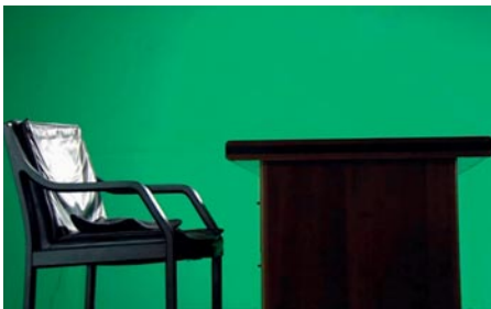
The Law in These Parts – Das Recht der Macht